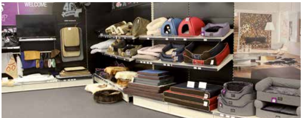
Alles, damit die Lieblinge bequem und gemütlich haben