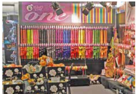
Farbige Leinen, ein fröhlicher Trend.